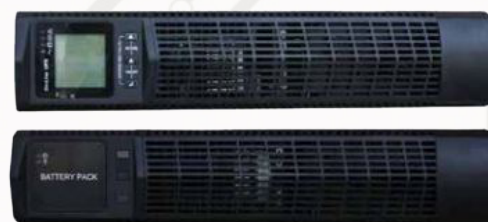
Установка в стойку. Напольная установка