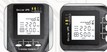
Два положения ЖКИ-дисплея