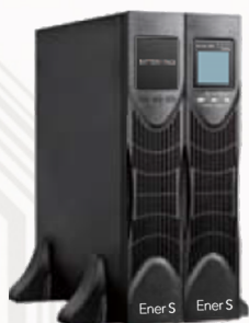
Батарейные модули (опция)